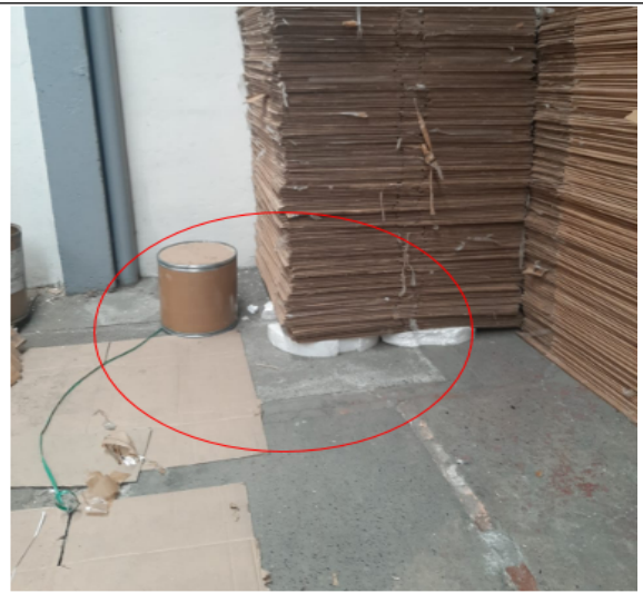
Foto No. 2. Vista general del pozo pz-10-0028