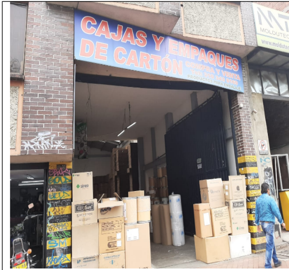
Foto No. 1. Fachada del predio