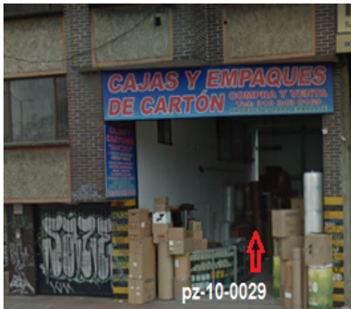
Fotografía 1. Vista de la fachada del predio, donde se localiza el pozo pz-10-0029.