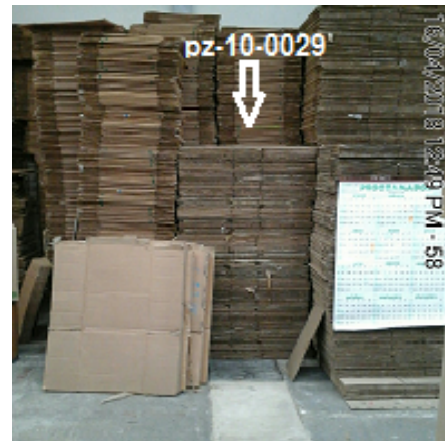
Fotografía 2. Vista General de la Ubicación de la boca del Pozo pz-10-0029.